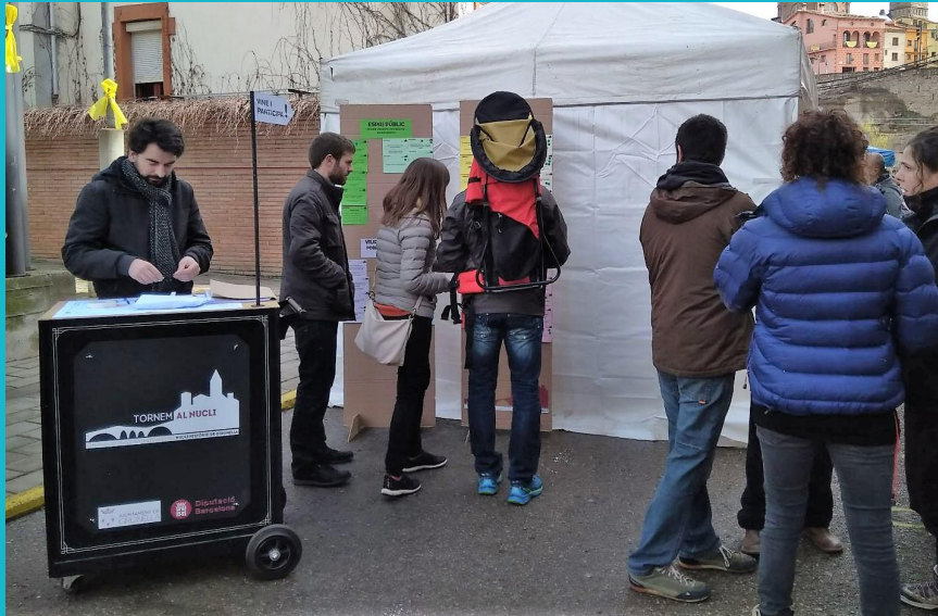
Punt Interacció Mòbil