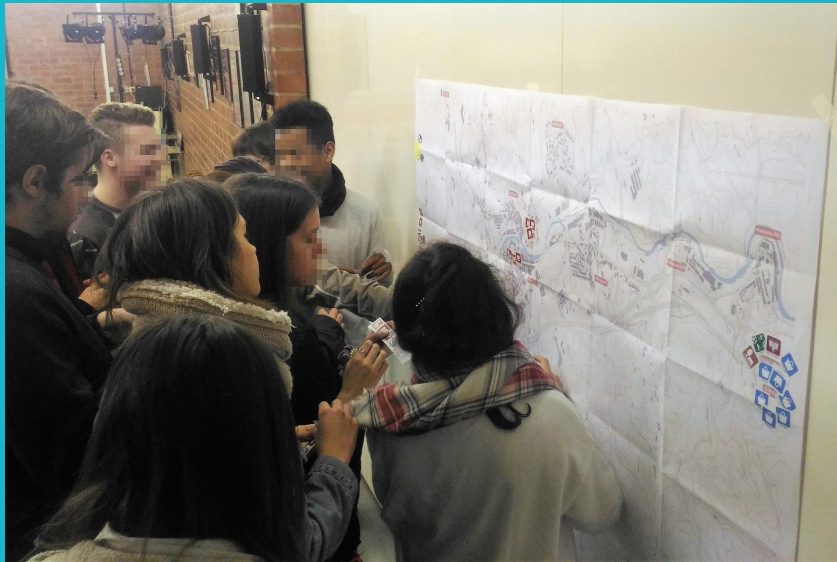
Tallers als instituts