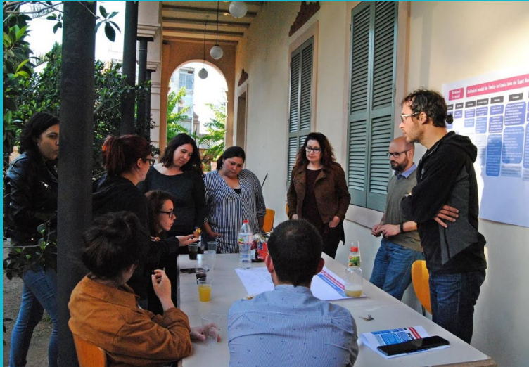
Dinàmiques de grup